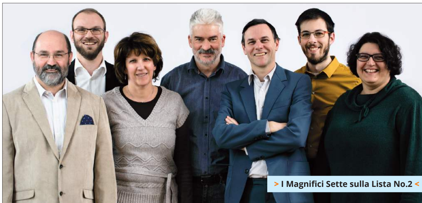
> I Magnifici Sette sulla Lista No.2 <